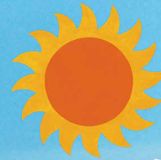
[ソーラーパネル設置]